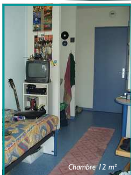
Chambre 12 m 2

De la chambre de 12 m 2 au studio de 25 m 2 , pour une nuit ou plusieurs mois, chaque logement vous accueille lors de votre passage chez nous.